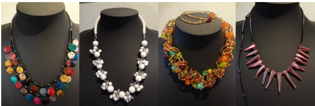
Enkele van de vele mogelijkheden