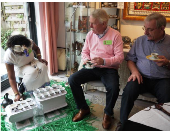
De traditionele koffie smaakt uitstekend!