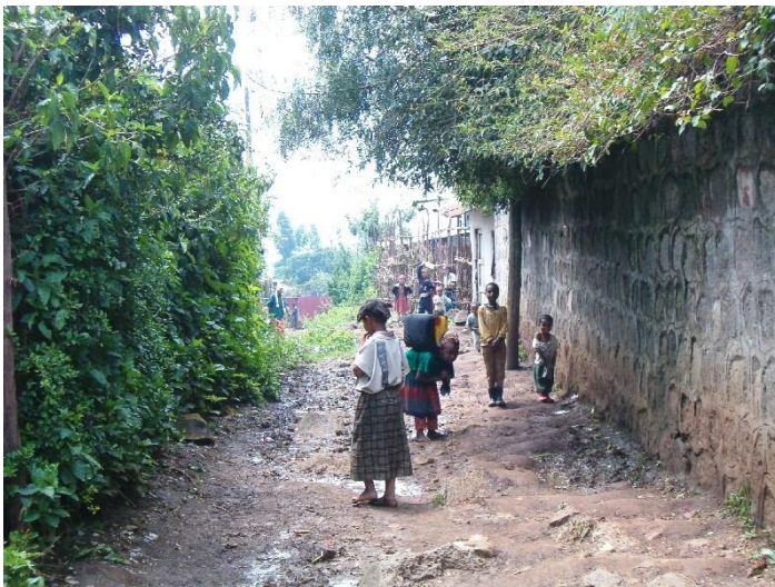
2004 - Karakore

Dit jaar is het 10 jaar geleden dat Food For All (FFA) werd opgericht. In die tien jaar is er wel het een en ander veranderd, zeker voor de vrouwen die wij via ons project hebben kunnen helpen. Toen wij tien jaar geleden samen met in Nederland wonende Ethiopiërs met FFA zijn gestart, bestond het bestuur uit vijf Ethiopiërs en één Nederlandse persoon. Op dit moment wordt het bestuur gevormd door vier Nederlandse en één Ethiopische persoon en we hebben twee Nederlandse adviseurs. We hopen binnenkort een tweede Ethiopisch bestuurslid te kunnen verwelkomen.