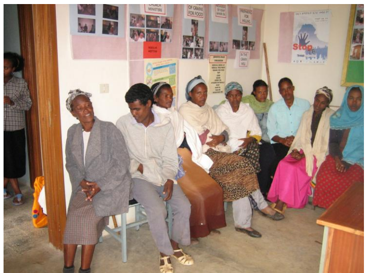
2007 - De eerste deelnemers aan ons project

Voordat wij in 2007 met het social center in de wijk Karakore gestart zijn, is er heel wat werk verzet om zover te komen. Allereerst moesten we als Nederlandse organisatie op zoek naar een Ethiopische partner die ons project zou kunnen en willen uitvoeren. Die partner hebben wij gevonden in de Presbyterian Church of Ethiopia (PCE), waar wij nog steeds mee samenwerken. Ook moest er nagedacht worden hoe wij ons project wilden gaan uitvoeren en dat vergde heel wat overleg, want onze Nederlandse ideeën bleken niet altijd te stroken met de Ethiopische.